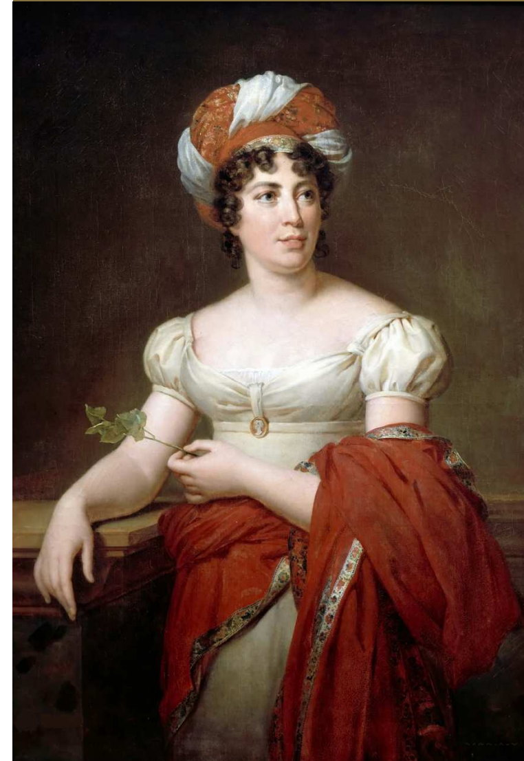
Ritratto di Mme de Staël